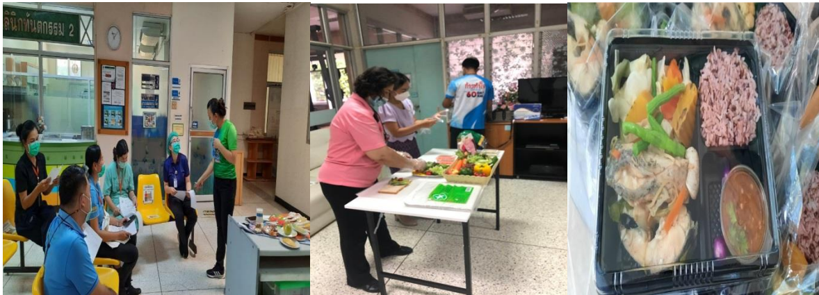
เรียนรู้ อ.อาหาร ป้องกันโรค NCD